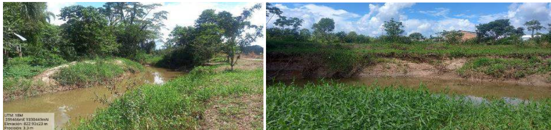
VISTA DE LA EROSIÓN QUE CAUSA EL RIO UQUIHUA EN EL SECTOR URIFICO.