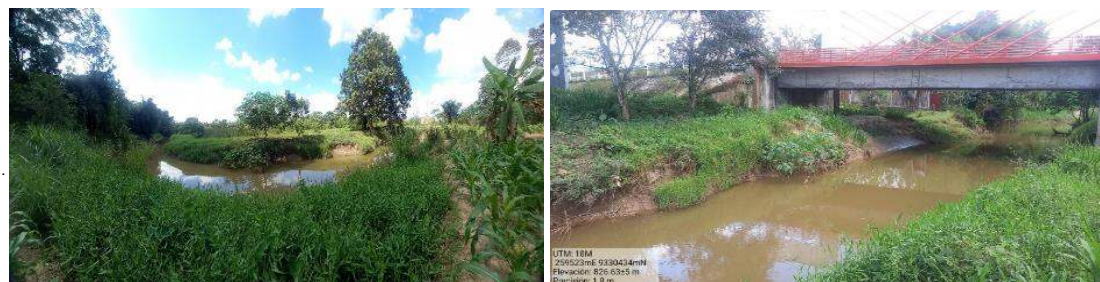
VISTA PANORÁMICA DEL RIO UQUIHUA EN EL SECTOR URIFICO Y LOS ELEMENTOS EXPOSTOS (PUENTE Y CULTIVOS)